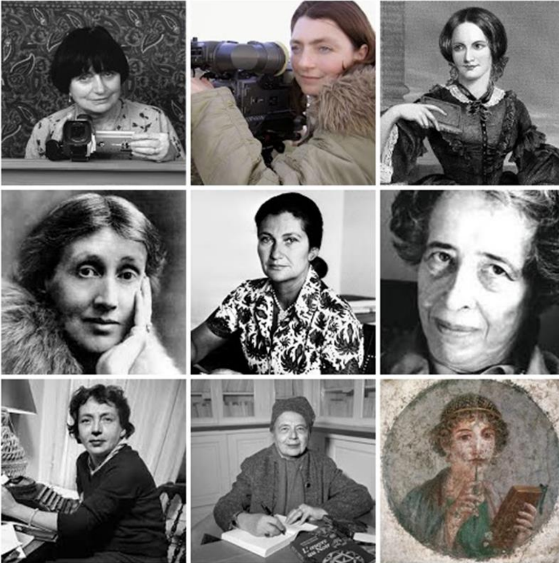
Agnès Varda, Solveig Anspach, Emily Brontë Virginia Woolf, Simone Weil, Hannah Arendt Marguerite Duras, Simone de Beauvoir, Jeune femme, Naples

Agrégation externe de géographie 2024-2025