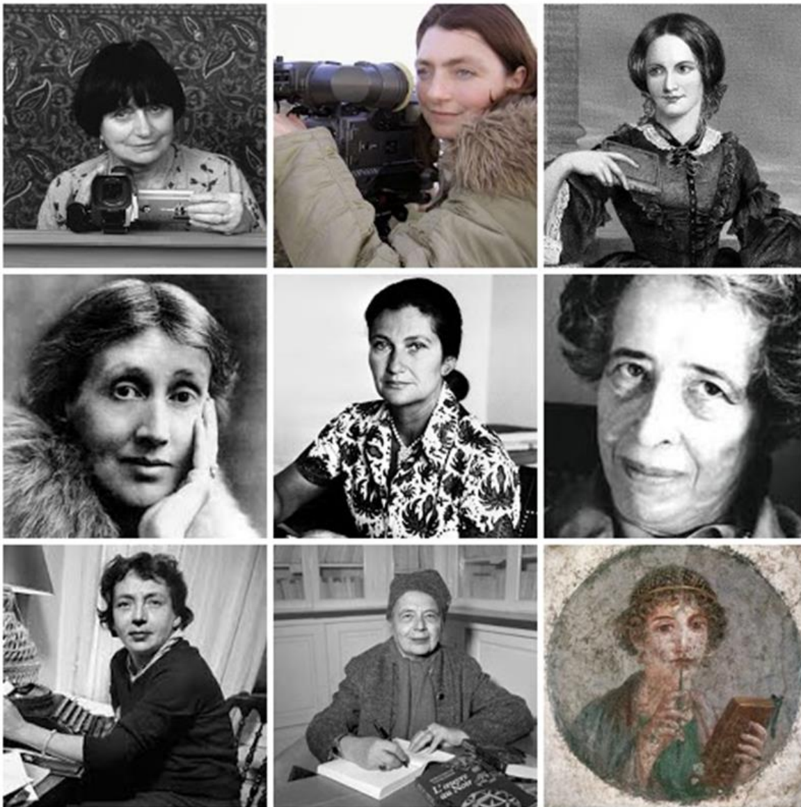
Agnès Varda, Solveig Anspach, Emily Brontë Virginia Woolf, Simone Veil, Hannah Arendt Marguerite Duras, Simone de Beauvoir, Jeune femme, Naples