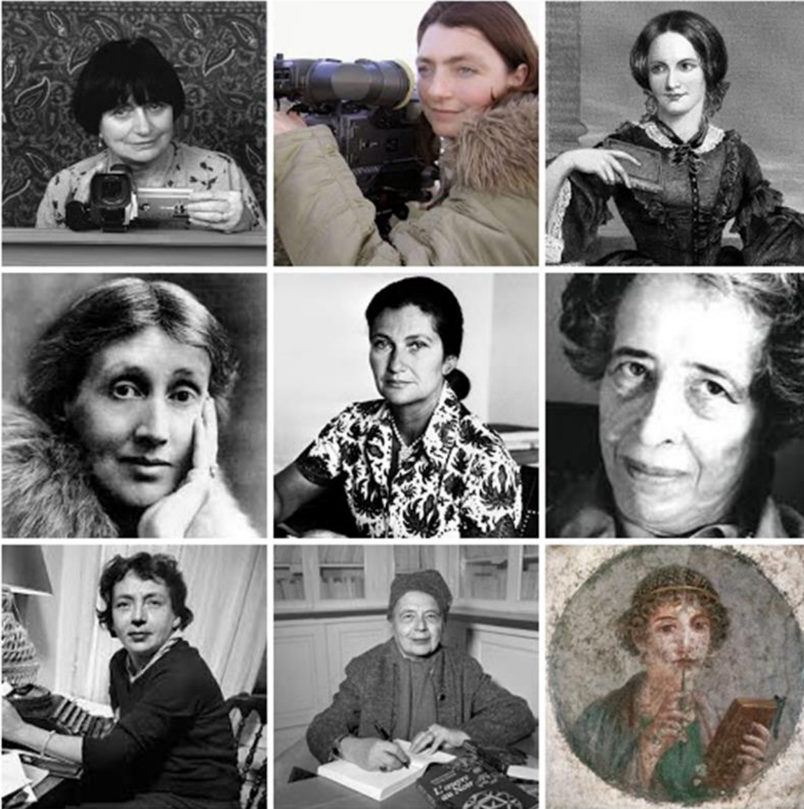
Agnès Varda, Solveig Anspach, Emily Brontë Virginia Woolf, Simone Veil, Hannah Arendt Marguerite Duras, Simone de Beauvoir, Jeune femme, Naples