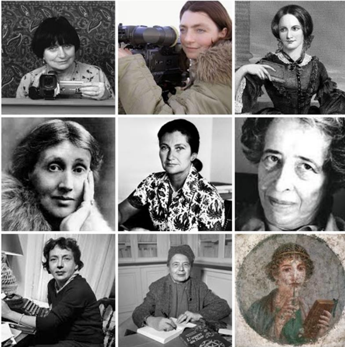
Agnès Varda, Solveig Anspach, Emily Brontë Virginia Woolf, Simone Weil, Hannah Arendt Marguerite Duras, Simone de Beauvoir, Jeune femme, Naples