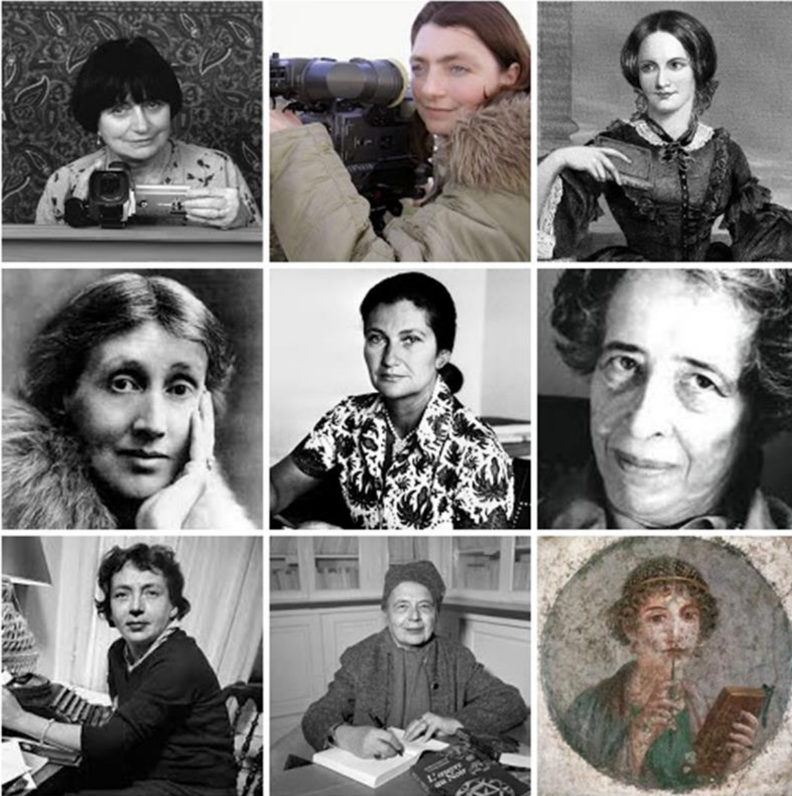
Agnès Varda, Solveig Anspach, Emily Brontë Virginia Woolf, Simone Weil, Hannah Arendt Marguerite Duras, Simone de Beauvoir, Jeune femme, Naples