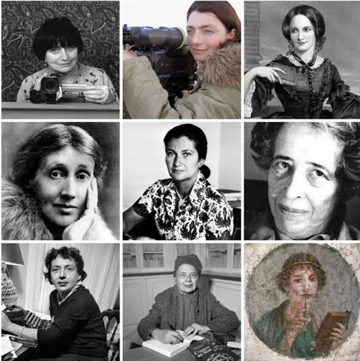
Agnès Varda, Solveig Anspach, Emily Brontë Virginia Woolf, Simone Weil, Hannah Arendt Marguerite Duras, Simone de Beauvoir, Jeune femme, Naples