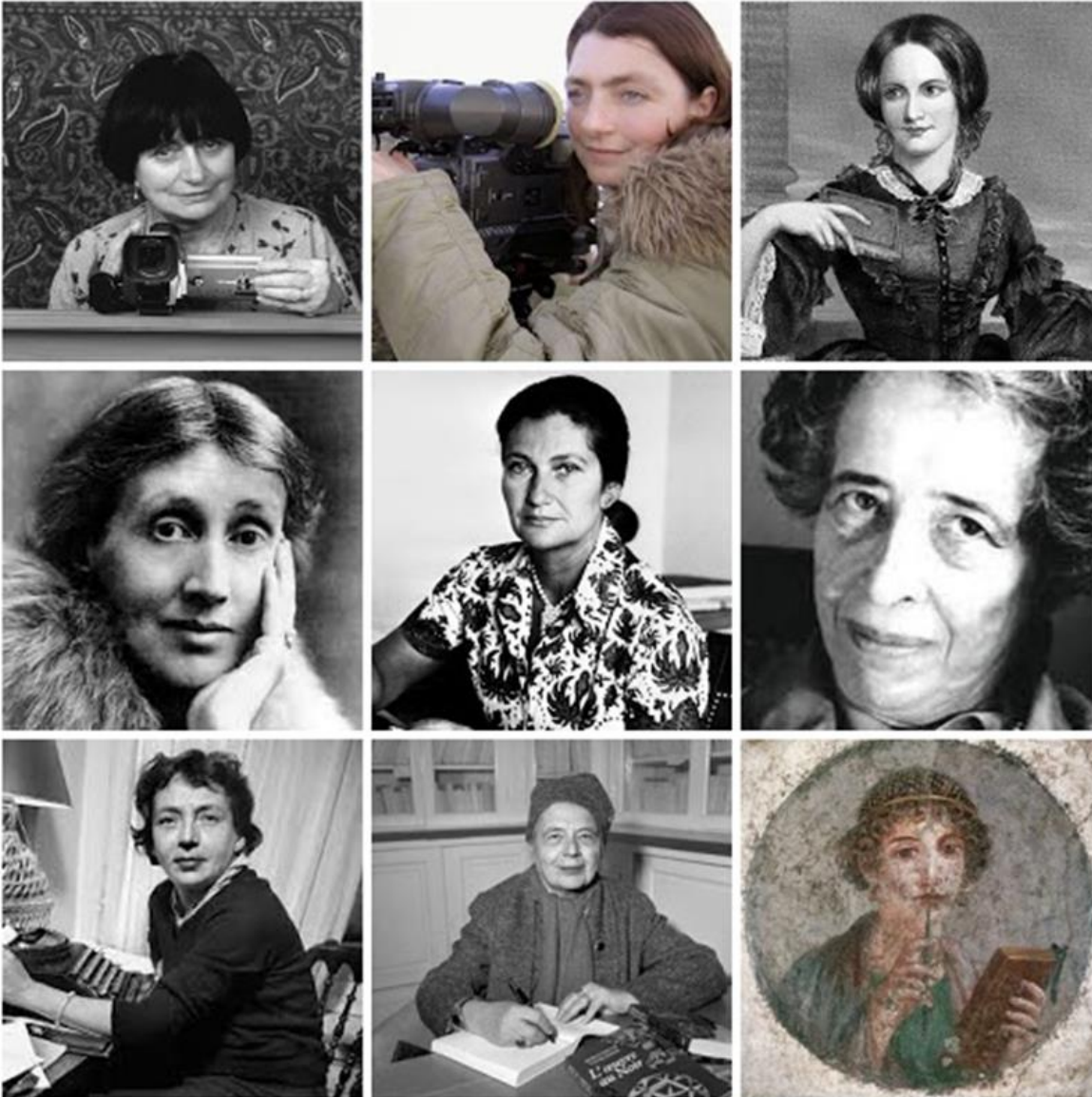
Agnès Varda, Solveig Anspach, Emily Brontë Virginia Woolf, Simone Weil, Hannah Arendt Marguerite Duras, Simone de Beauvoir, Jeune femme, Naples