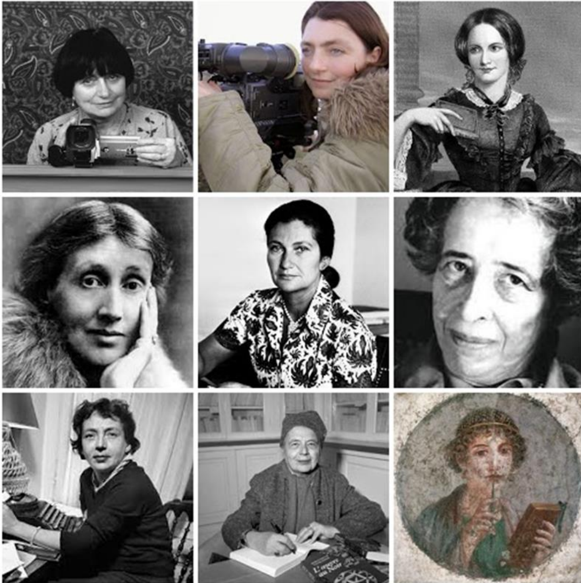
Agnès Varda, Solveig Anspach, Emily Brontë Virginia Woolf, Simone Veil, Hannah Arendt Marguerite Duras, Simone de Beauvoir, Jeune femme, Naples